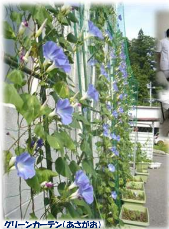
グリーンカーテン(あさがお)