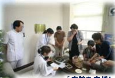
「病院を応援し 隊」の皆さんか らの差し入れ