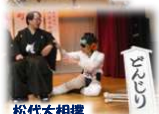
松代大相撲 (どんじりを取る)